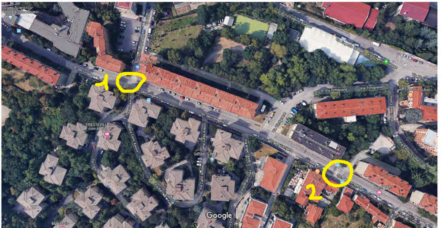
Da piazzale Timignano alla confluenza con via Cozzi.